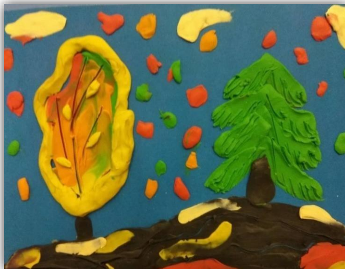
Рисование пластилином «Осень»