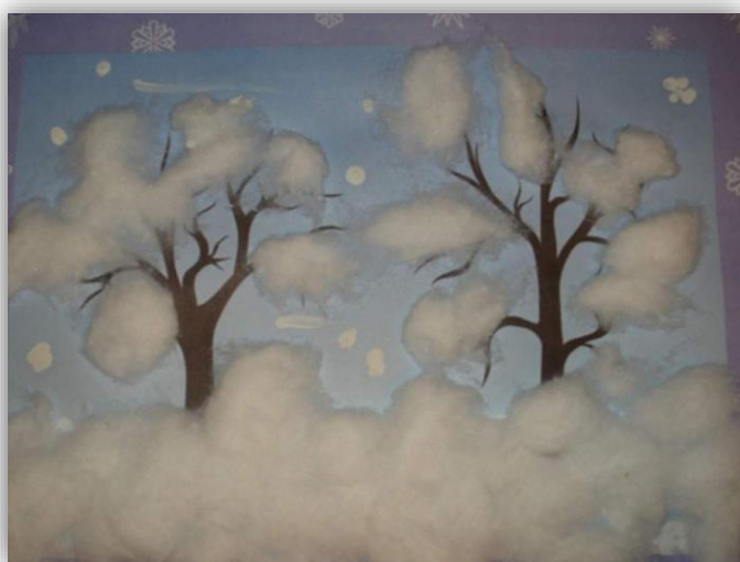
Рисование ватой «Зимушка-зима»