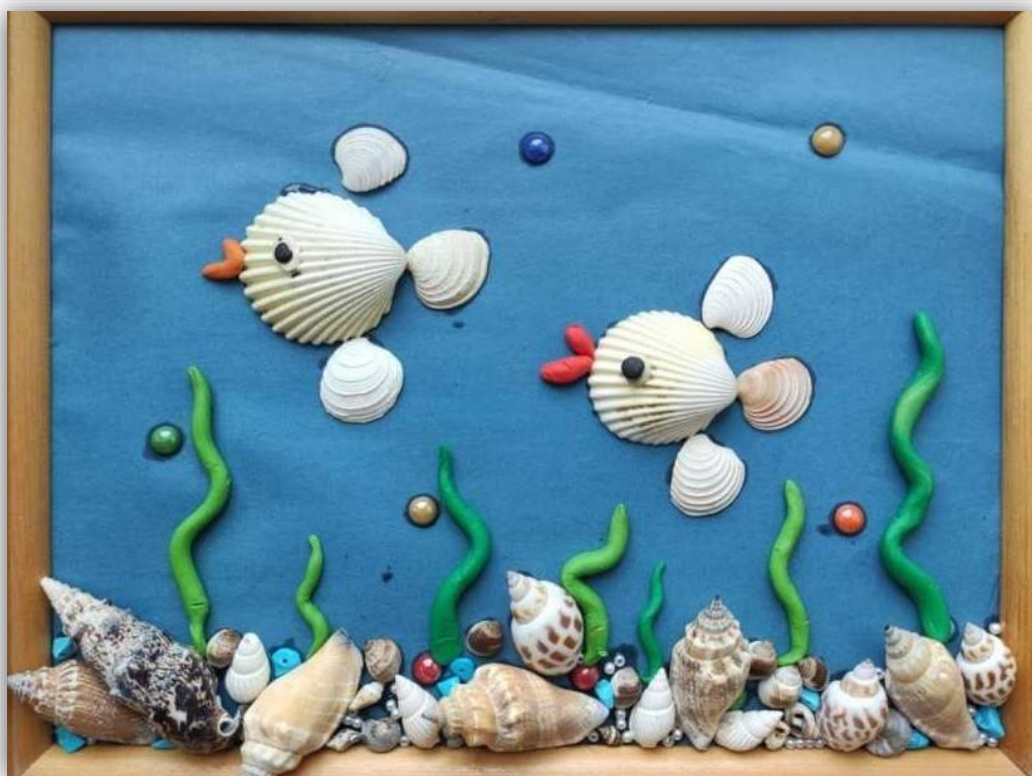
Аппликация из ракушек