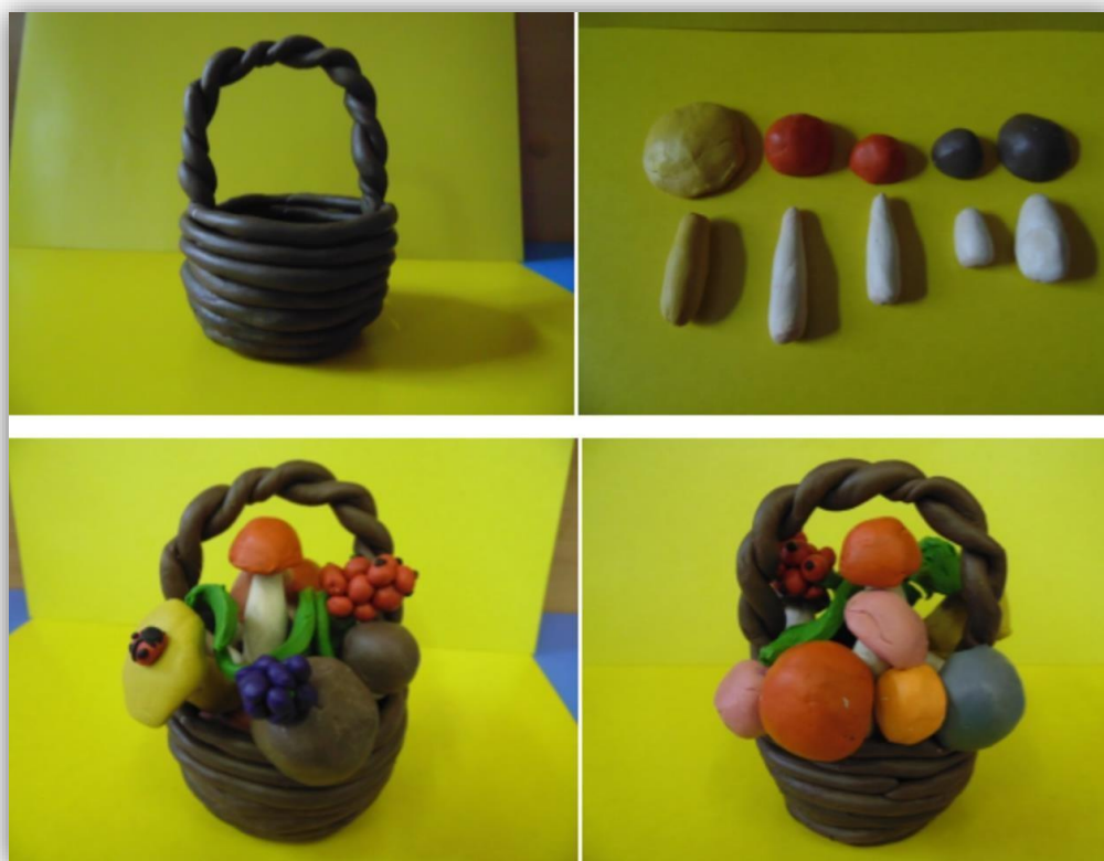
Лепка «Грибы в корзинке»