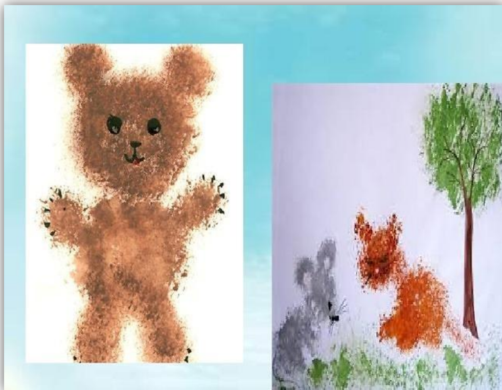
Рисование смятой бумагой «Шубка животных»