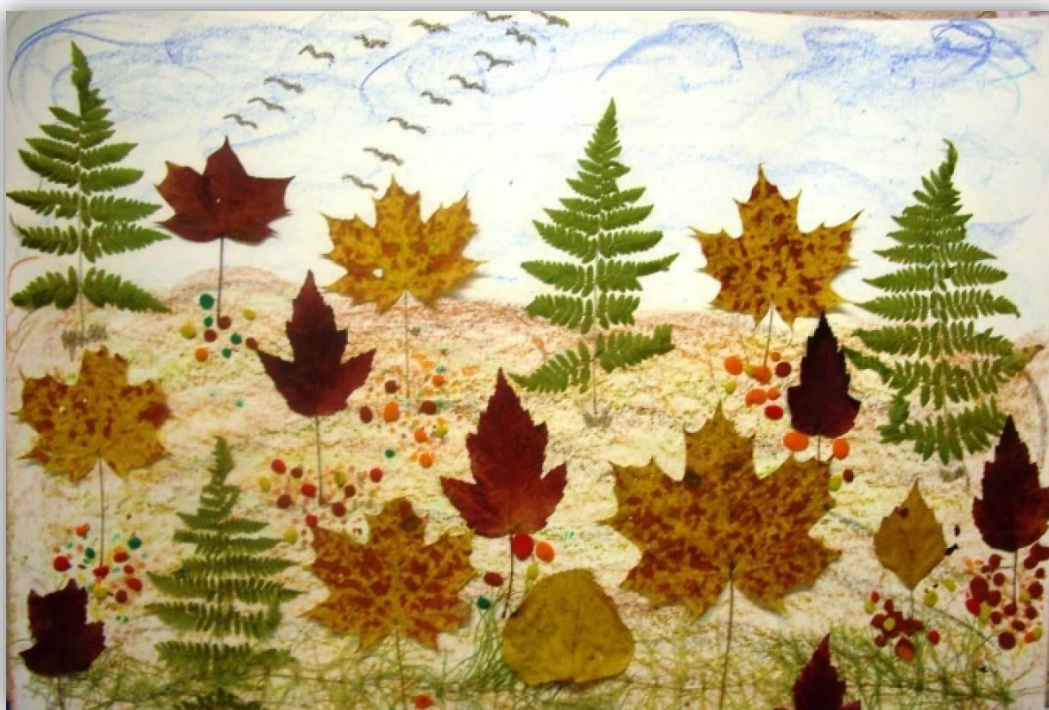
Коллективная работа из природного материала «В осеннем лесу»