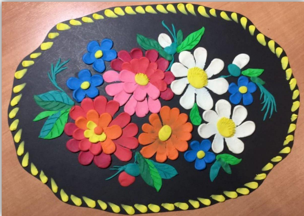
Изготовление подарка для мам «Цветы на подносе»