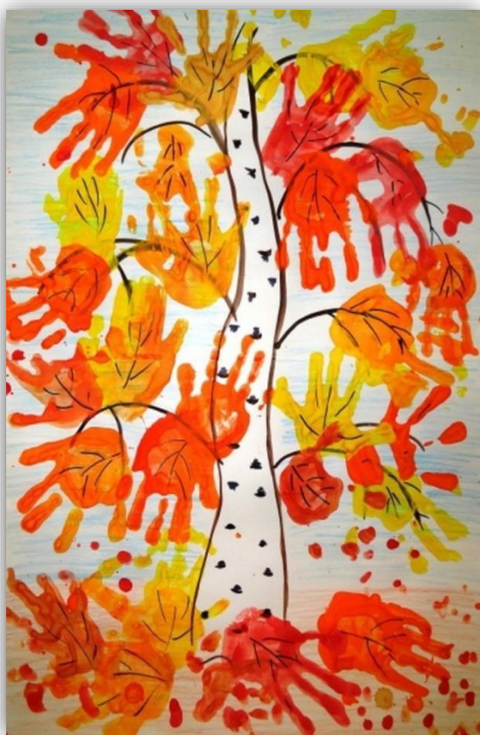
Рисование ладошкой «Листочки»