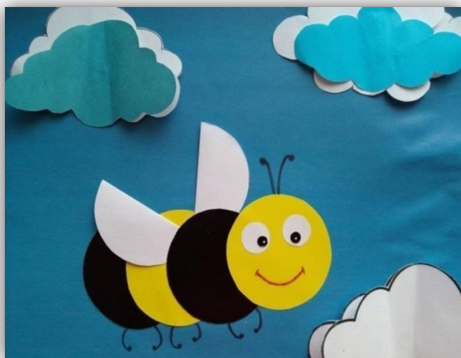
Аппликация из бумаги и фетра «Пчелка»