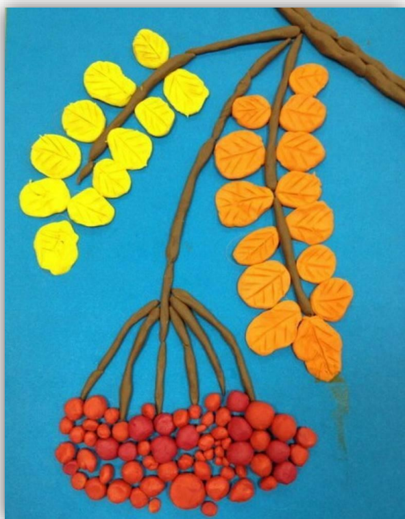
Лепка «Веточка рябины»