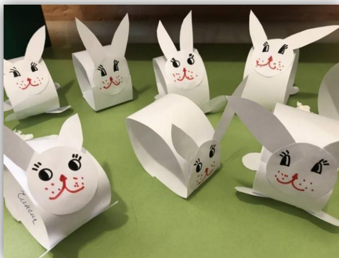
Объемное конструирование из бумаги «Зайчата»