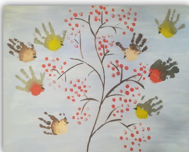
Рисование ладошкой «Птицы»