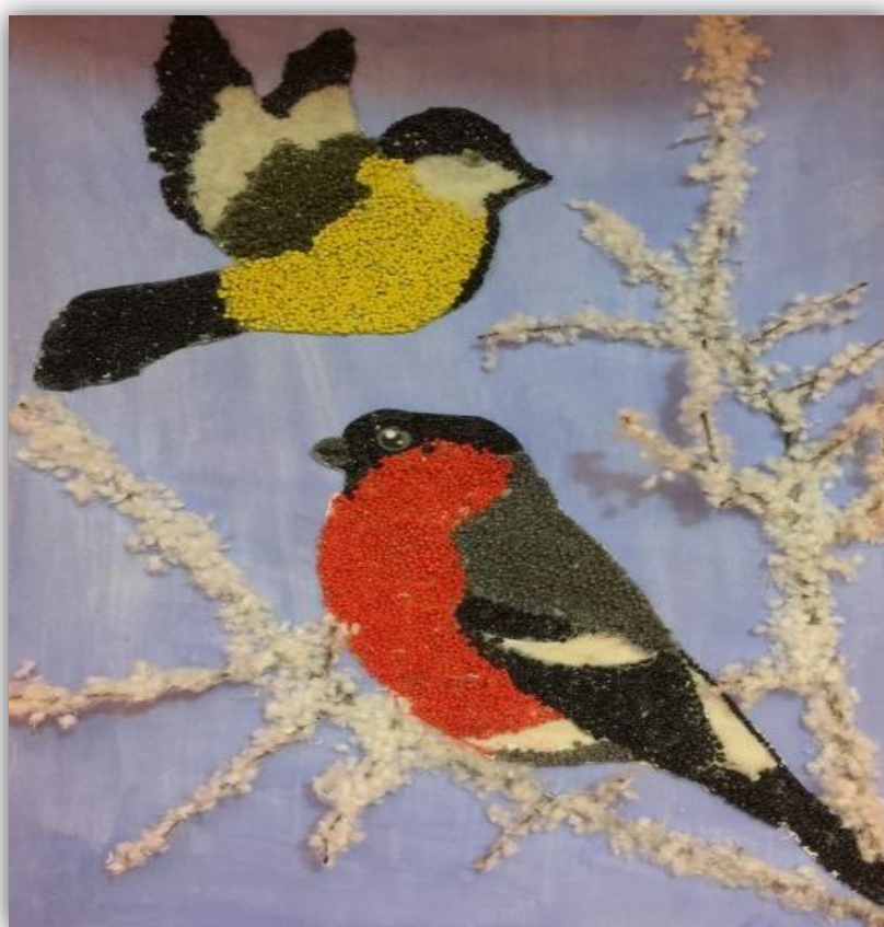
Коллективная работа из крашеного пшена «Птица на ветке»