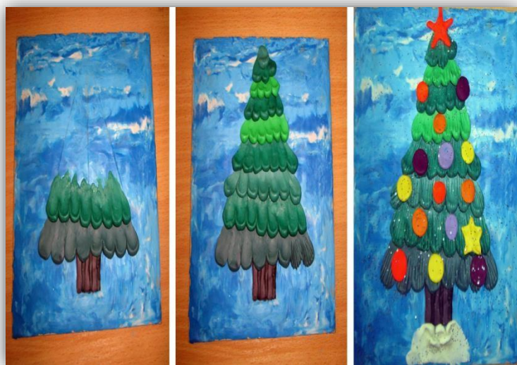
Лепка «Ёлочка нарядная»